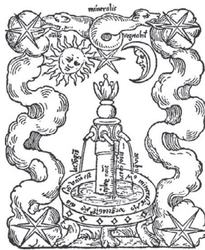
Logoul Fundației de Psihologie Jungiană, Küssnacht, Elveția: Fons mercurialis din Rosarium Philosophorum , 1550 („Fântâna vieții“)