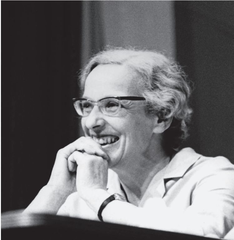
Marie-Louise von Franz 1915-1998